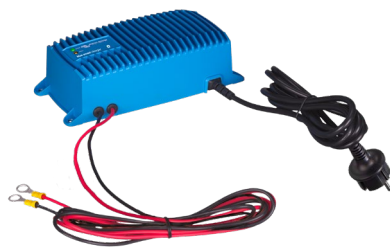
Blue Smart IP67 Ladegerät 12/25